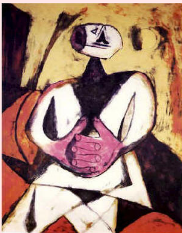
Hombre mirando la luna, 1955 Rufino Tamayo

Esas primeras experiencias pueden constituir el primer factor de riesgo del que parten algunos de estos niños y niñas. Sin embargo, también hay quienes, afortunadamente, han tenido la oportunidad de establecer unas primeras relaciones positivas con familiares o cuidadores, lo que será, sin duda alguna, muy favorable en su desarrollo.