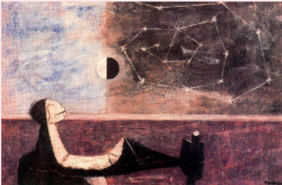
El hombre ante el infinito, 1950 Rufino Tamayo

Entre los primeros encontramos las dificultades asociadas al embarazo y a algunas conductas de riesgo durante el mismo, así como a la forma y condiciones en que se produjo el parto, situaciones de pobreza extrema, negligencia física y/o afectiva, largas estancias en hospitales y/o instituciones masificadas y con pocos recursos, y ausencia de vínculos significativos, entre otros.