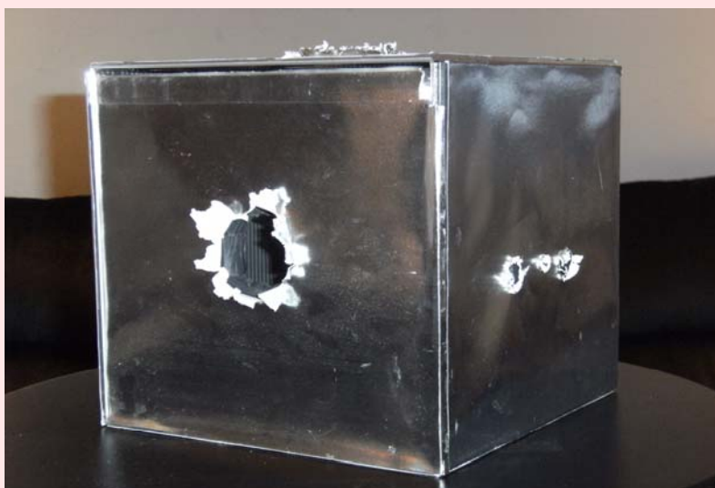
Solitud, 2008 Júlia Rodríguez

Durante la última década, la adopción internacional consiguió una enorme visibilidad y aceptación social. Convencidos de que no necesitaban compartir material genético con sus hijos para sentirlos como tales, decenas de miles de españoles iniciaron los trámites para adoptar un niño de otro país. Como los padres biológicos, la mayor parte de ellos deseaba que sus hijos fueran sanos, y tan pequeños como fuera posible. Sólo la falsa creencia de que existían millones de bebés y niños pequeños privados de familia y la perduración de antiguas concepciones según las cuales una adopción debe resolver las dificultades de una pareja explica que la decisión de elegir el país de su futuro hijo recayera sobre los adoptantes y no fueran los países de origen quienes dijeran qué familias necesitaban para proteger a los menores que carecían de ella.